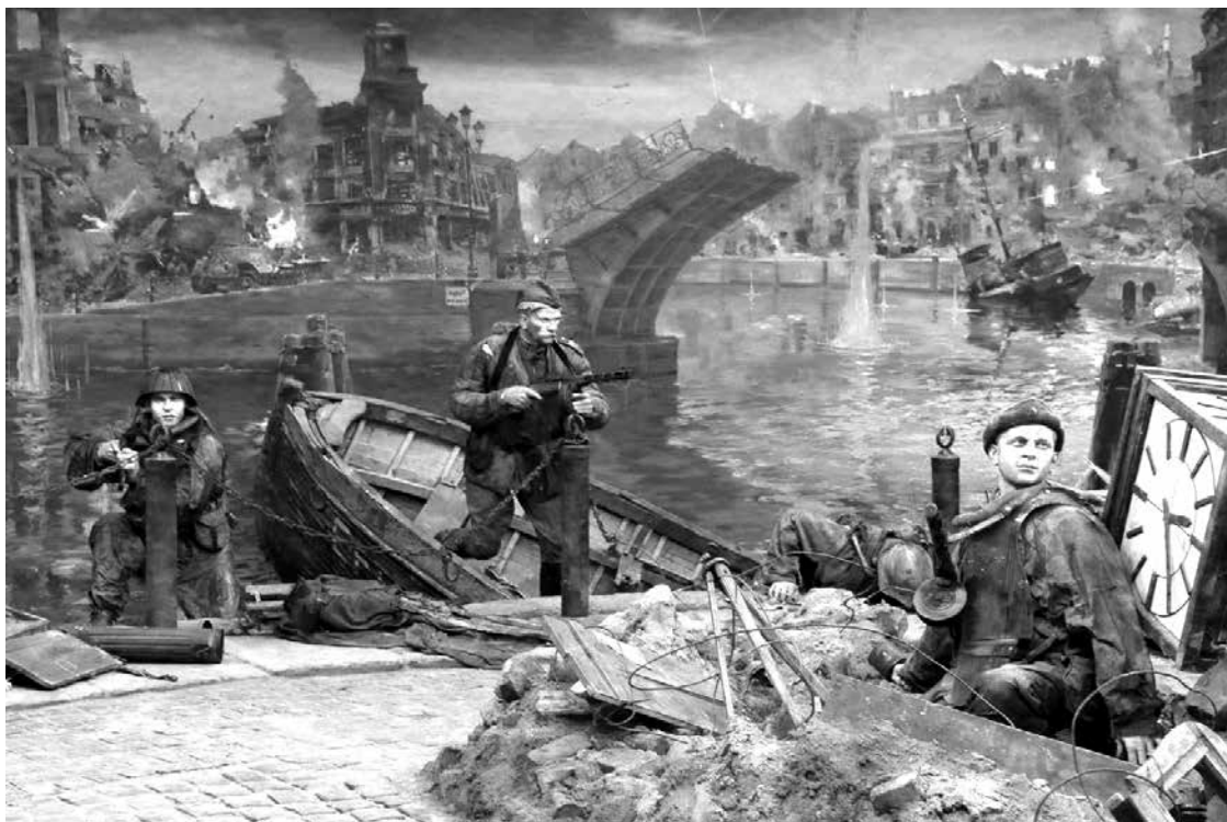
«Кёнигсберг-45. Последний штурм». Трёхмерная панорама в Историко-художественном музее Калининграда.

По случаю 80-летнего юбилея со дня победоносного штурма города и крепости Кёнигсберг и в СМИ, и в Рунете потоком научные и историко-публицистические статьи, посвящённые этому памятного в летописи Великой Отечественной событию, причём за авторством во многих случаях титулованных учёных – докторов и кандидатов исторических наук.