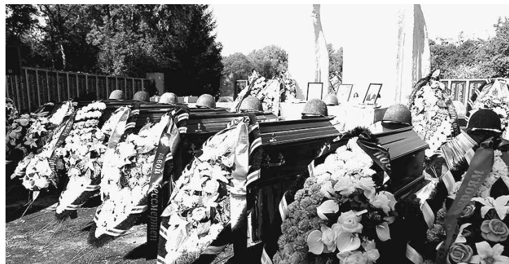
Мемориал в посёлке Корнево Багратионовского района по количеству захороненных бойцов и командиров Красной армии – один из крупнейших военных мемориалов в Калининградской области.

Участники почтили память погибших 80 лет назад