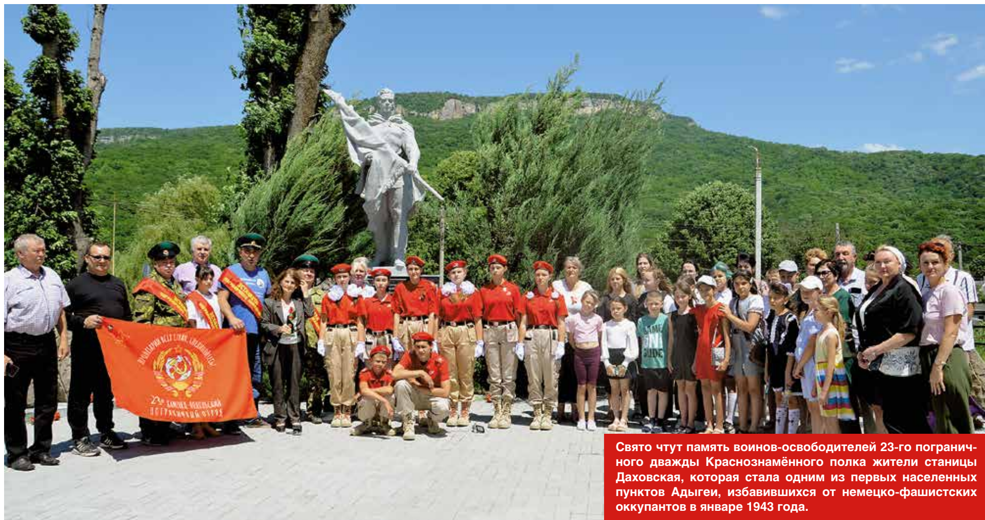
Свято чтут память воинов-освободителей 23-го пограничного дважды Краснознамённого полка жители станицы Даховская, которая стала одним из первых населенных пунктов Адыгеи, избавившихся от немецко-фашистских оккупантов в январе 1943 года.