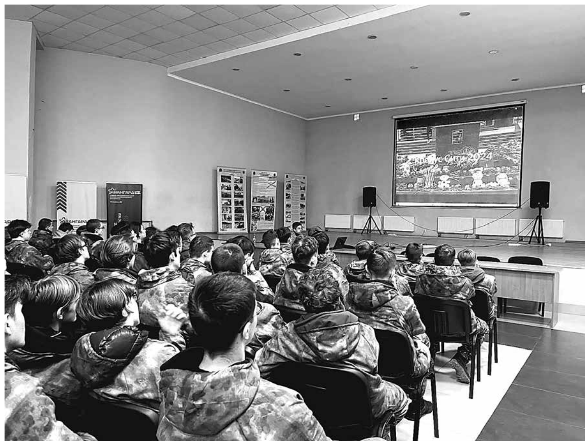
Совет ветеранов УФСБ России по Калининградской области во взаимодействии с работниками военно-патриотического центра «Авангард» в г. Светлогорске ведёт свой невидимый бой на идеологическом фронте за будущее поколение страны.

– На протяжении всего периода реализации проекта мы работали в тесном контакте. Ещё до начала проекта согласовали идею с руководством Управления, со стороны которого был назначен куратор. Через него мы взаимодействовали с различными подразделениями в оперативном режиме, поскольку речь шла не только о патриотическом воспитании подростков, но и о предупреждении