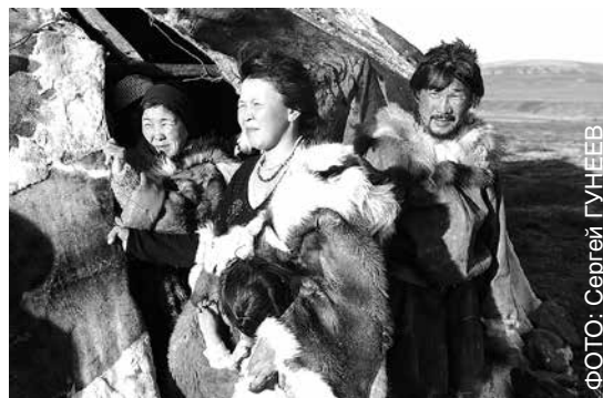
На стойбище чукчей-оленьеводов посёлка Канчалан Чукотского автономного округа

Напомним, что в июле российский лидер подписал указ об утверждении Основ государственной языковой политики Российской Федерации. Стратегический документ призван сохранить, развить и поддержать русский язык, государственные языки российских республик и различных народов страны, а также продвинуть русский язык в мире и определить современное состояние, цели, основные принципы реализации, задачи, механизмы и инструменты государственной языковой политики.