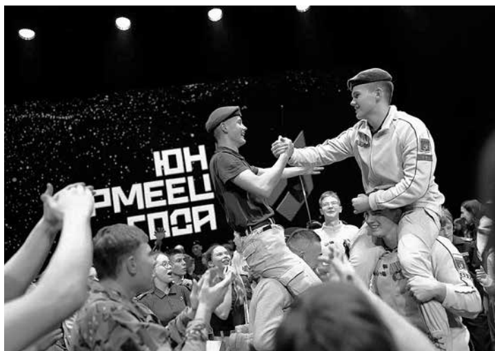
Юнармеец обязан стремиться к победам в учёбе и спорте, вести здоровый образ жизни, готовить себя к служению и созиданию на благо Отечества.

Напомним, масштабный региональный конкурс «Юнармеец года» проводится в рамках реализации Всероссийского конкурса программ комплексного развития молодёжной политики «Регион для молодых» Федерального агентства по делам молодёжи, а также в целях выявления и поощрения лучших юнармейцев, повышения качества работы по гражданско-патриотическому воспитанию молодёжи и обеспечению преемственности лучших традиций военно-па-