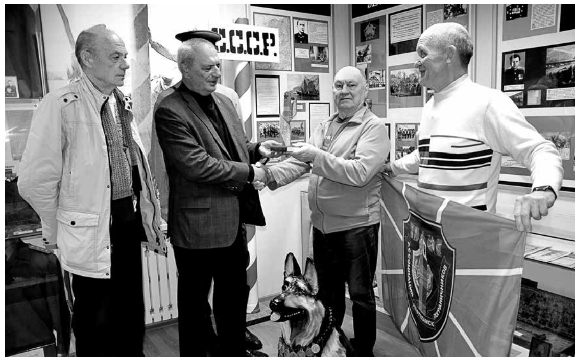
Экспозиция музея Пограничного управления ФСБ России по Калининградской области пополнилась необычными экспонатами из Республики Башкортостан.

Давняя дружба связывает ветеранов границы Республики Башкортостан и Калининградской области