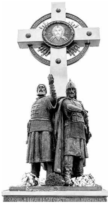
В День народного единства – 4 ноября 2019 года в Ярославле на территории Кирилло-Афанасиевского монастыря установлен памятник Кузьме Минину и Дмитрию Пожарскому.

А КПД от них – велик ли?.. От того, что мы провозглашаем: данный год посвящаем... Чему-то – для абстрактных рассуждений не так уж и принципиально.