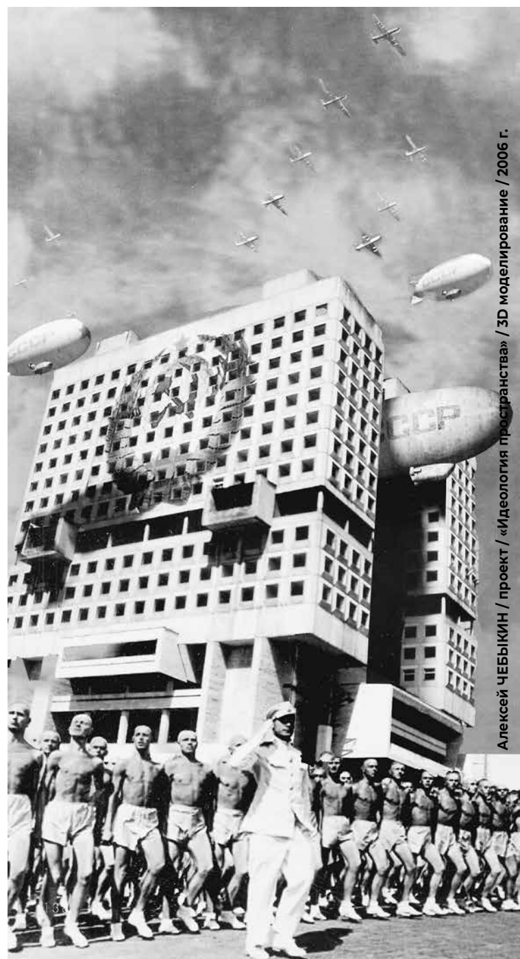
Дом Советов – самый масштабный проект, которому нет аналогов. Строительство здания началось в 1970 году. Считался одним из символов и главным «долгостроем» Калининграда. Снесён в 2024 году.

Знаменательным фактом стало возведение грандиозного фундаментального здания на Центральной площади, прозванного Домом Советов. Оно строилось на века и несло в себе глубокий смысл. На общем фундаменте стояли два высоких корпуса соединяемых несколькими переходами, это символизировало единство светской и