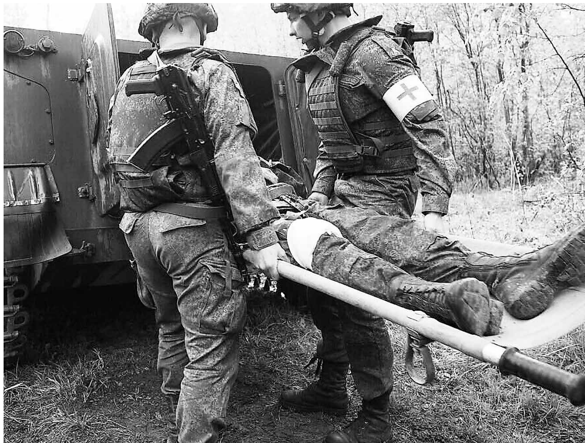
На переднем крае работа групп эвакуации раненых бойцов по своему риску, пожалуй, не уступает боевой работе штурмовиков. Порой сложно даже самому выйти с линии боевого соприкосновения, не попав под обстрел.

А мир сейчас другой. И «Юрист» с «Рассветом» делают свой, спасающий. Обустраивают.