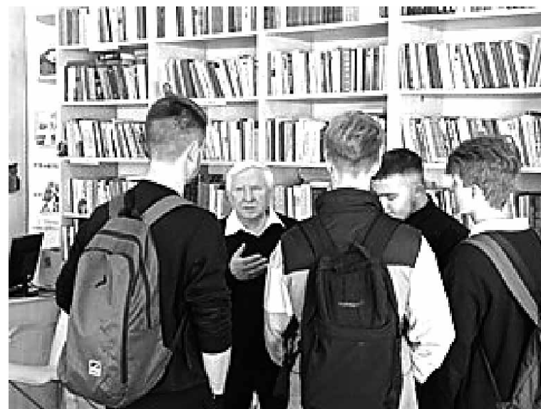
Неформальное общение – важная составляющая работы со школьниками.

– Главным для нас было довести до сведения подростков пошаговую информацию о технологии вербовки: подкуп, шантаж, закрепление, формирование феномена «мы». Важно, что после таких встреч были случаи, когда дети подходили к нам и откровенно рассказывали о подобных ситуациях, в которых они оказались. Разумеется, в этих случаях мы работали в тесном контакте с профильными подразделениями Управления ФСБ.